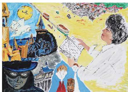
全附P連絵画コンクール 2022年度会長賞