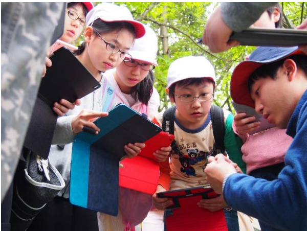
一人1台タブレット端末をもって思考ツールとして活用