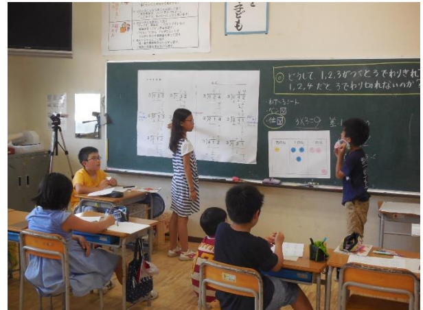
子どもが学習リーダーとなり，主体的に授業を進める