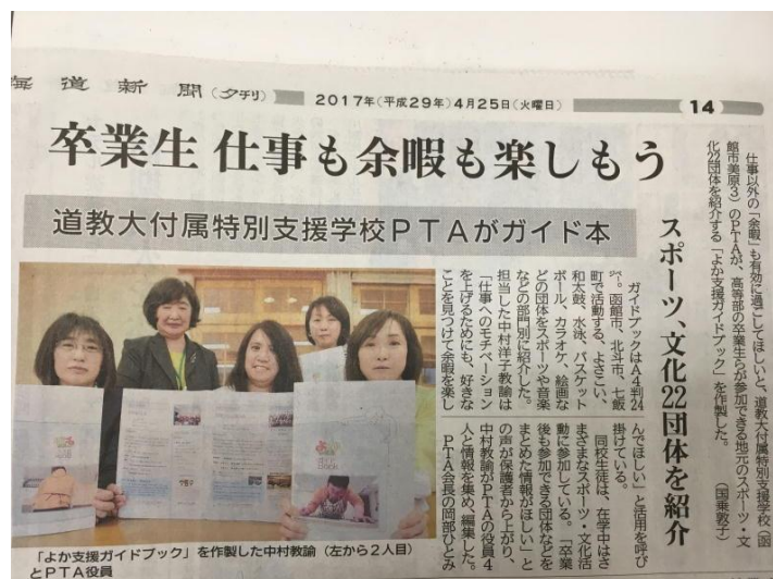
北海道新聞に掲載される (H29. 4. 25)