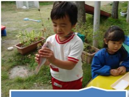
不思議との出会い

本園では、子どもが主体となる保育について研究と実践を進めてきている。園生活の主人公としての子どもを教師と保護者が手を携えて支えていく、子どもの願いに真摯に応える研究と実践を目指している。子どもが主体となる保育を目的に、子ども自身が不思議と出会い、仲間と出会い、文化と出会い、そして対話をしながら、成長していく過程を研究的な保育実践によって支えることを試みている。