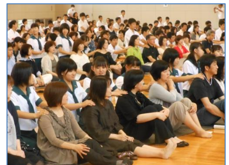
親子ふれあい活動における ストレスマネジメント