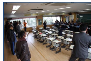
ブータンの教員団