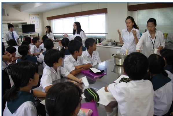
台北教育大学の教育実習生による授業

本校では、平成25年度より台湾の大直高級中学と姉妹校提携を結んでいる。英語科の授業において、ICT機器を用いて、大直高級中学との遠隔交流を行っている。台湾の生徒の英語力は高く、本校の生徒にも大きな刺激となっている。