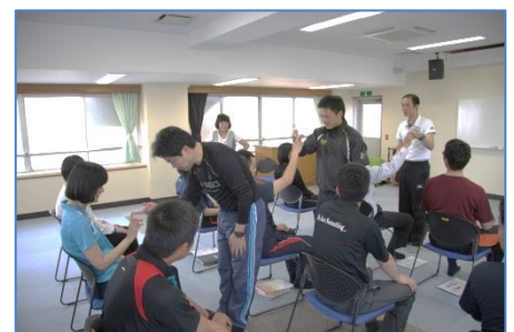
ストレスマネジメントの職員研修