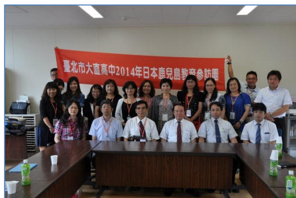
大直高級中学教員団の来校