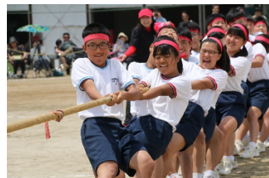
熱戦が繰り広げられる体育大会

行事の中でも特に附中三大行事とよばれる「体育大会」、「文化祭」、「合唱祭」に全校生徒が主体的に関わっているのが本校の特色である。生徒自らが行事を企画、運営し、創り上げていくこの三大行事は、人間関係能力を磨くばかりでなく、卒業後も長く語り継がれるほど思い出に残るものであり、附属小倉中学校を代表する行事です。