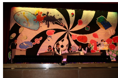
創意工夫が見られる文化祭